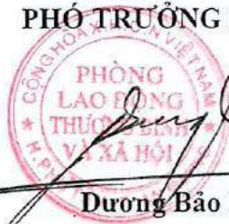
Dương Bảo Lộc

PHÒNG LAO ĐỘNG - TBXH KT. TRƯỞNG PHÒNG PHÓ TRƯỞNG PHÒNG